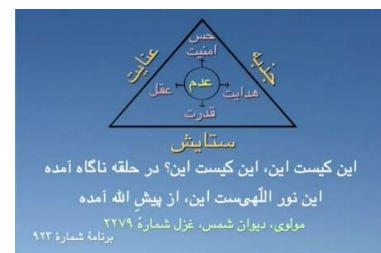
شکل ۸ (مثلث ستایش با مرکز عدم)