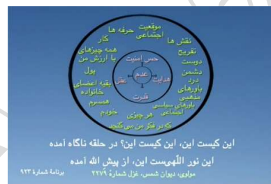
شکل ۲ (دایره عدم)

و همین‌طور که می‌بینید، بیت اول را اگر ما با این شکل‌ها بررسی کنیم [شکل ۰ (دایره عدم اولیه)] ابتدا ما به‌صورت هشیاری بی‌فرم وارد این جهان می‌شویم، مرکز ما عدم است و این چهارتا خاصیت عقل و حس امنیت و هدایت و قدرت را از او می‌گیریم.