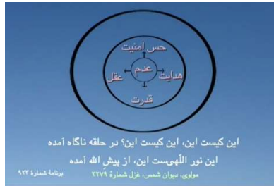
شکل ۰ (دایره عدم اولیه)