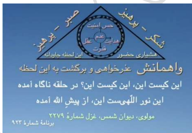
شکل ۶ (مثلث واهمانش)