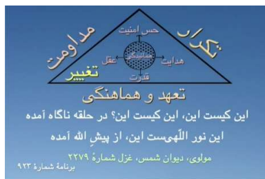
شکل ۳ (مثلت تغییر با مرکز همانیده)

برای همین می گوید «من گرم می شوم» اما نه از گفت و گو، بلکه از آن آفتابی که از مرکز من طلوع می کند و آنجا معدن است. پس این فضای گشوده شده «تبریز همچو معدن» است، فضای یکتایی تبریز معدن است و از آنجا من به صورت آفتاب بالا می آیم.