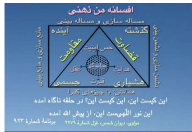
شکل ۹ (افسانه من ذهنی)