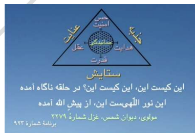
شکل ۷ (مثلث ستایش با مرکز همانیدگی‌ها)