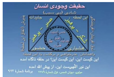
شکل ۱۰ (حقیقت وجودی انسان)

[شکل ۴ (مثلث تغییر با مرکز عدم)] رسیدیم به بیت اول دوباره [شکل ۴ (مثلث تغییر با مرکز عدم)] انشاءالله که این ابیات مفید بوده باشد. گفت: