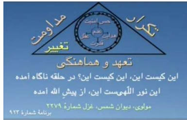
شکل ۴ (مثلث تغییر با مرکز عدم)