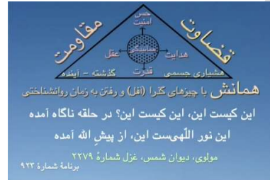
شکل ۵ (مثلث هماننش)