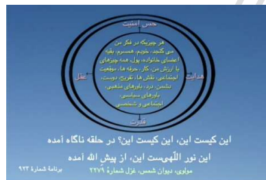
شکل ۱ (دایره همانیدگی‌ها)